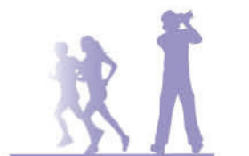
Recreatie, toerisme en beleving