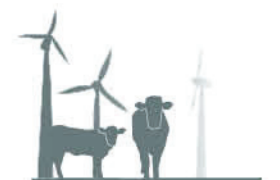
Productie: landbouw en energie