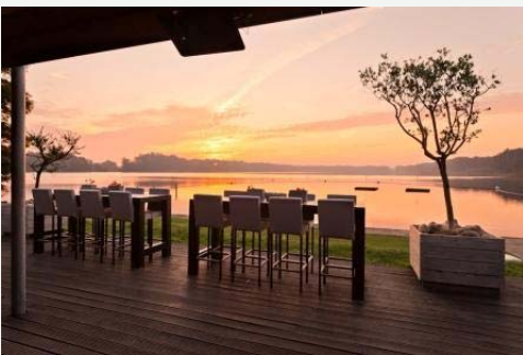
Uitzicht op de Maarsseveense Plassen