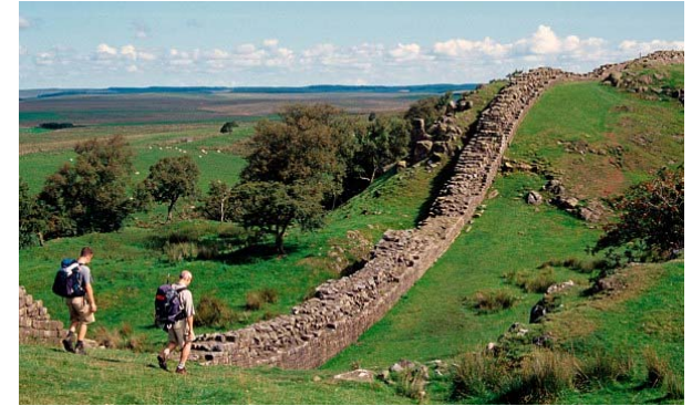
Hadrian' s Wall